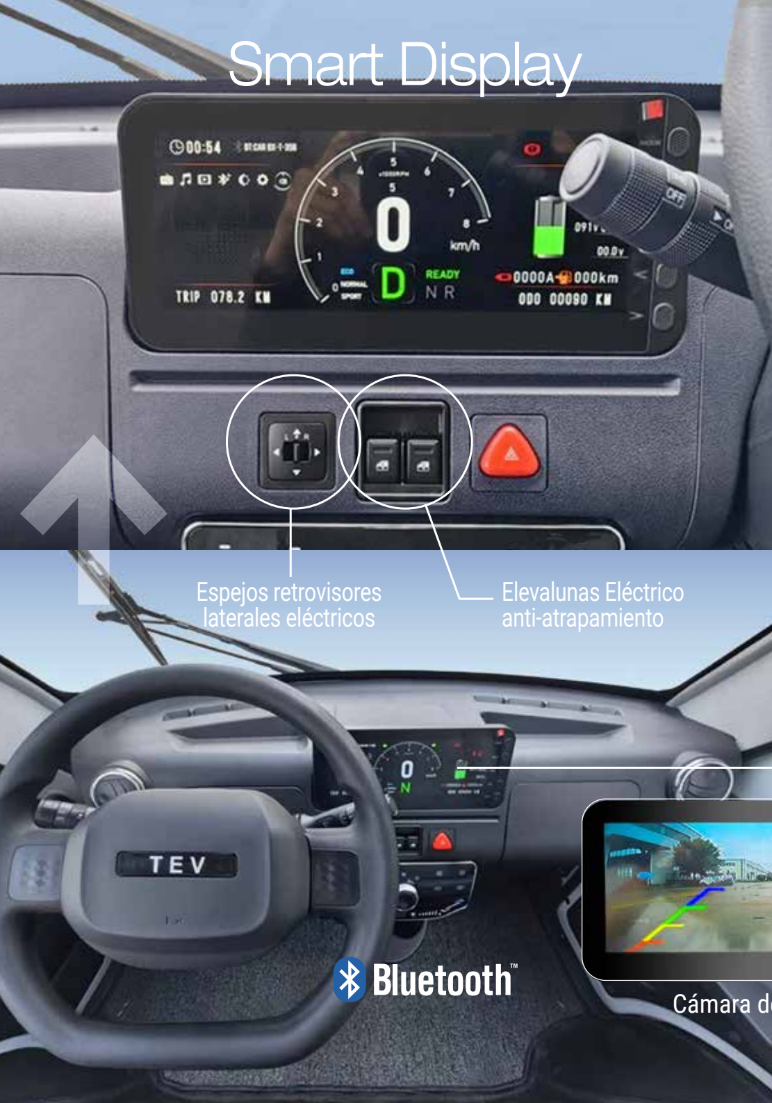
Espejos retrovisores laterales eléctricos