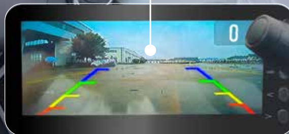
Cámara de vision trasera