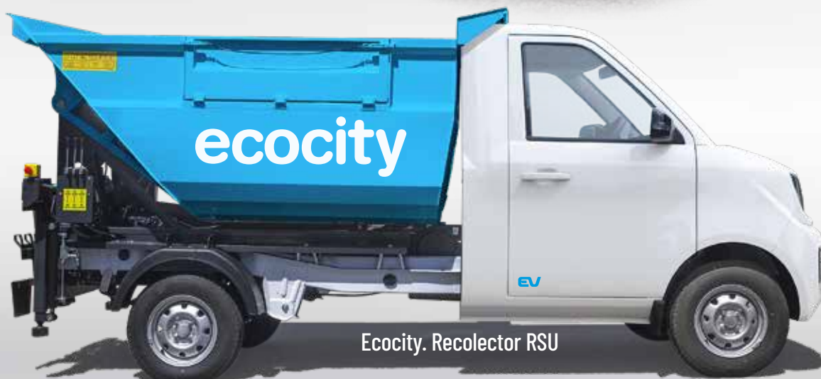
Ecocity. Recolector RSU