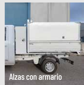
Alzas con armario