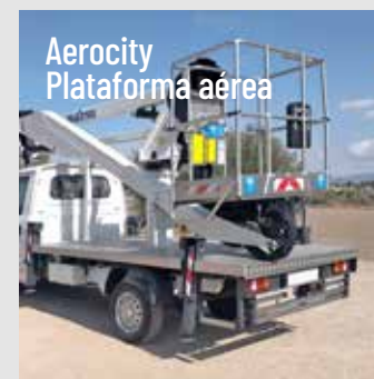
Aerocity Plataforma aérea