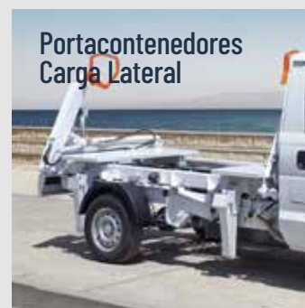
Portacontenedores Carga Lateral