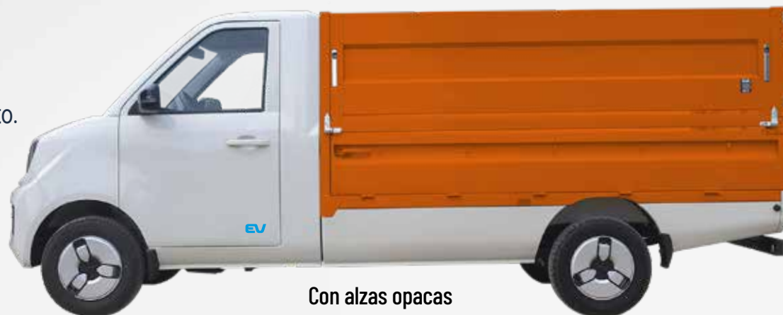
Con alzas opacas

Configurable. El Q21EV es un vehículo polivalente y carrozable como todos los modelos de nuestra gama.