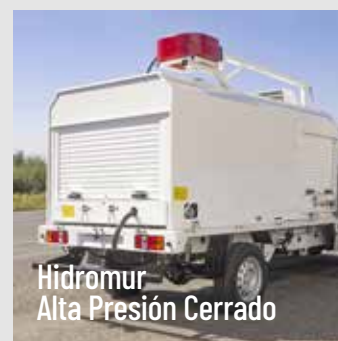
Hidromur Alta Presión Cerrado