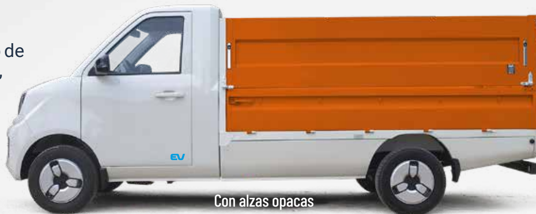
Con alzas opacas

Configurable. El Q21EV es un vehículo polivalente y carrozable como todos los modelos de nuestra gama.