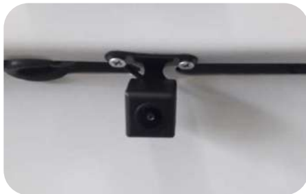
Camara de visión trasera