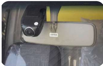
Camara de videograbación de circulación delantera