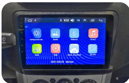
Pantalla táctil 9,11" Equipo multimedia.