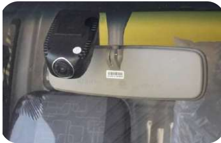
Camara de videograbación de circulación delantera