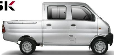
PICK UP DC